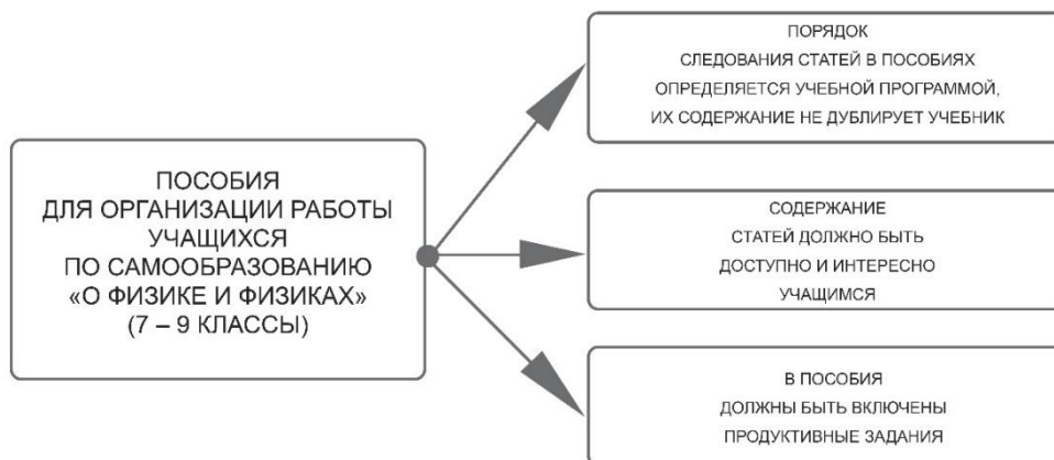
Рис. 2. Дидактические требования к пособиям для организации работы учащихся по самообразованию «О физике и физиках» (7-9 классы)

Рассмотрим далее результаты проектирования дидактических пособий «О физике и физиках», используемых для организации работы учащихся по самообразованию в 7-9 классах. «Мозговой штурм», проведённый совместно с коллегами, позволил сформулировать следующие дидактические требования к данным пособиям (Рис. 2):