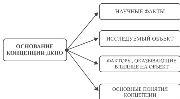
Рис. 1. Элементы, составляющие основание концепции ДКПО

Элементы, составляющие основание концепции , указаны на рис. 1.