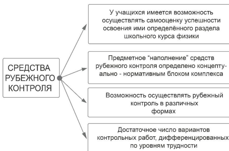
Рисунок 3. Требования к средствам рубежного контроля предметных знаний учащихся (составлено автором)

Для проведения рубежного контроля в форме устного зачёта и письменной контрольной работы в тематические тетради по предмету для учеников включены вопросы к зачёту по каждому разделу программы и примерные варианты контрольных работ, а также варианты контрольных работ содержатся в сборниках «Самостоятельные и контрольные работы по физике для 7–9 классов». Дидактическое конструирование средств рубежного контроля было проведено в соответствии с рядом требований (рис. 3).